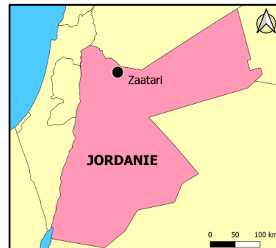
Document 1 – L'installation d'un camp de réfugiés syriens à Zaatari.

Le camp de Zaatari accueille des réfugiés syriens fuyant la guerre civile syrienne depuis 2012. Les conditions de vie des 80 000 personnes qui y vivent sont difficiles malgré l'aide internationale.